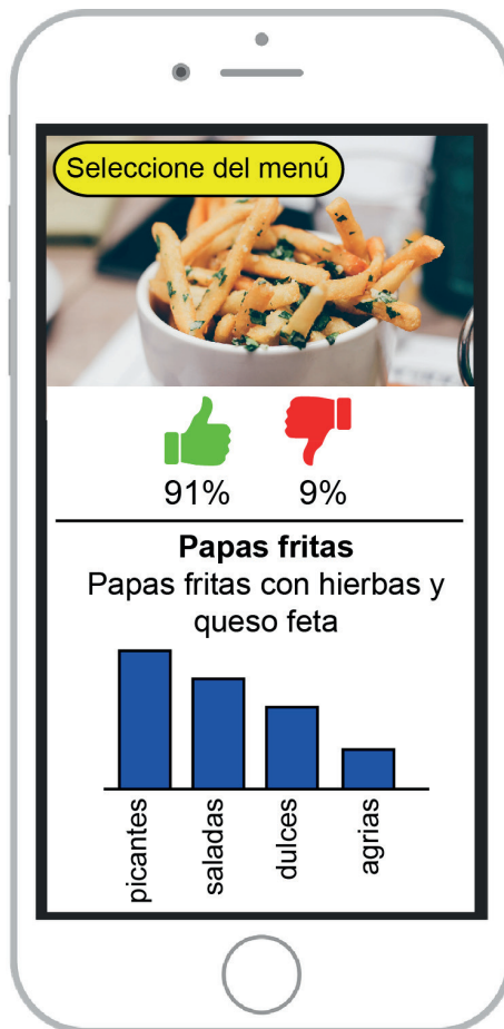
Figura 1: App Tasty