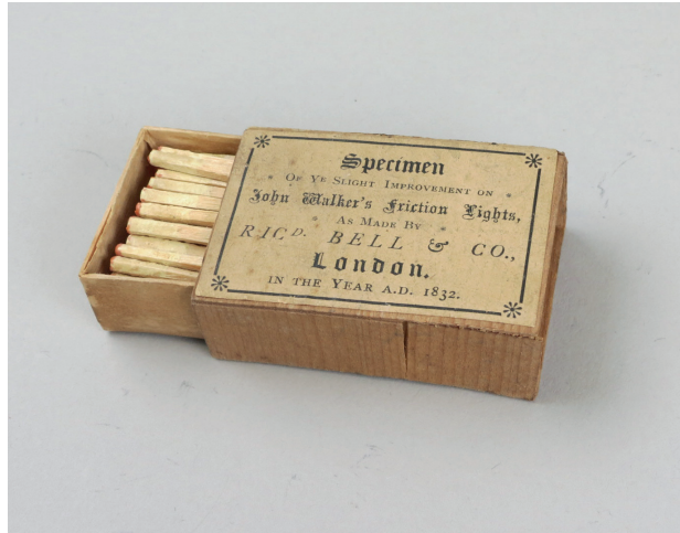
Figura 5: Las cerillas “Friction Lights”