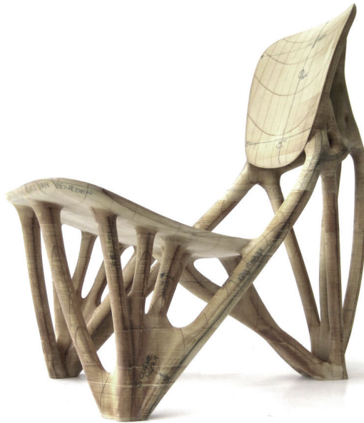
Figura 3: Silla Bone de papel