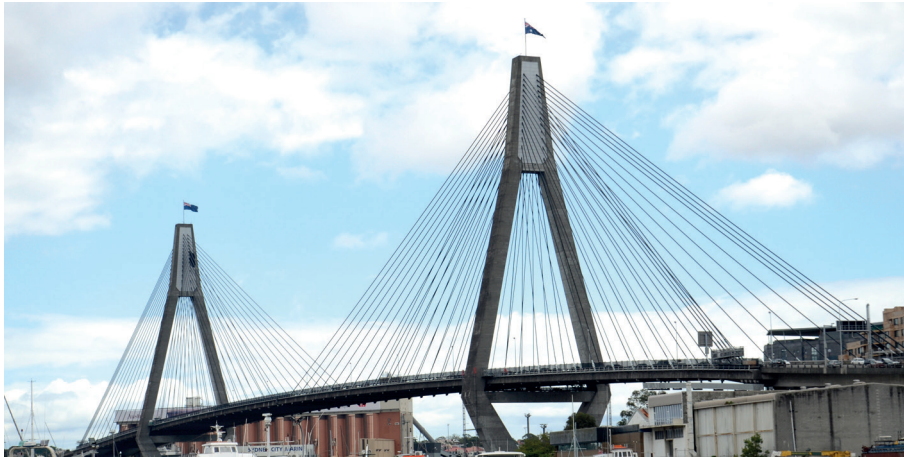
Figura 6: Puente Anzac