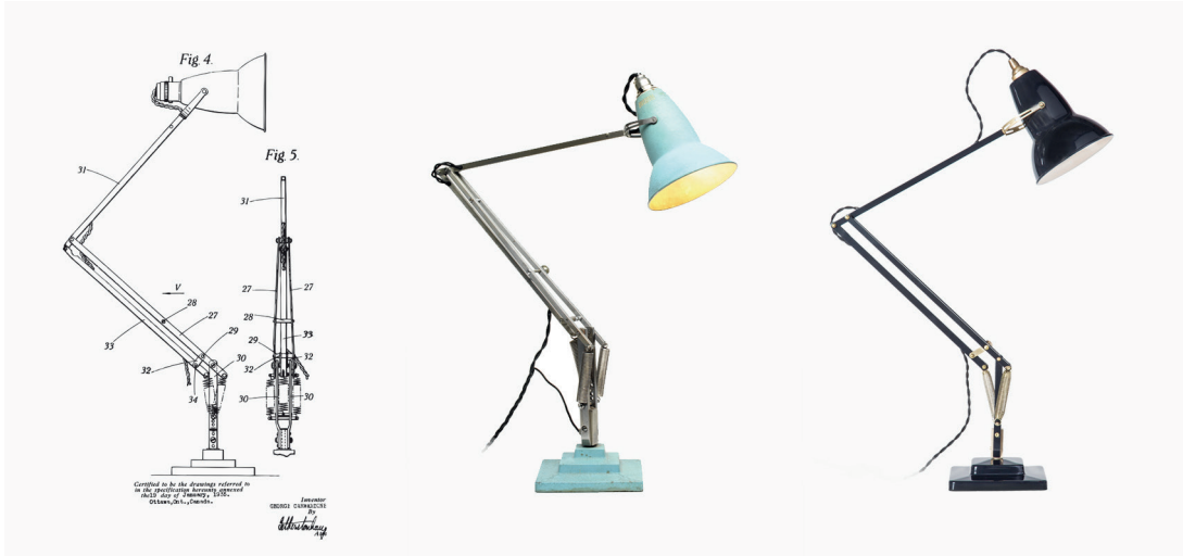
Figura 5: Lámpara Anglepoise