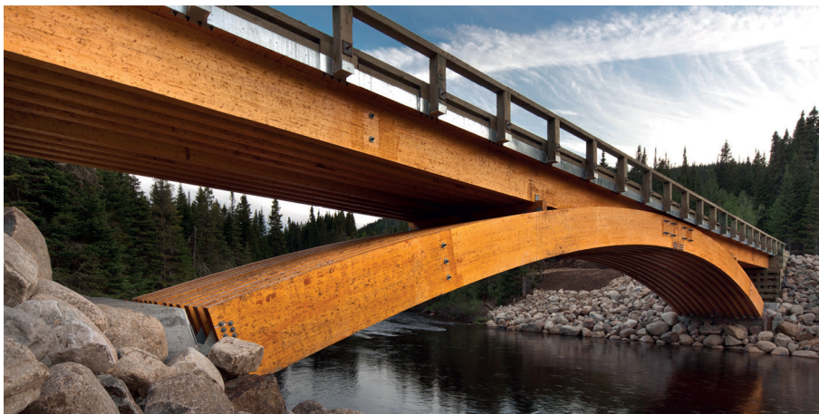
Figura 7: Puente de madera

En otros casos, los diseñadores de puentes han usados materiales tradicionales como madera. En la figura 7 se muestra un puente de madera en Canadá.