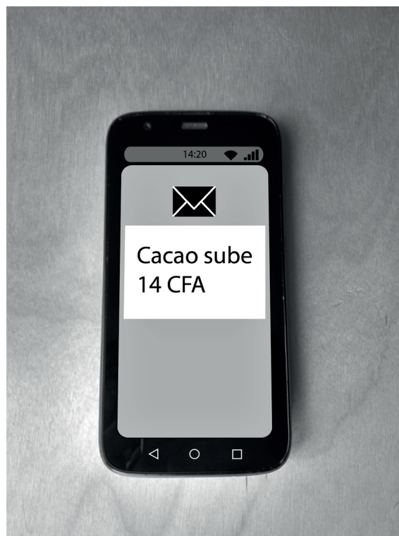
Figura 1: Ejemplo de un mensaje de texto