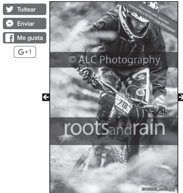
Figura 2: Ejemplo de una imagen de baja resolución del sitio web de ALC