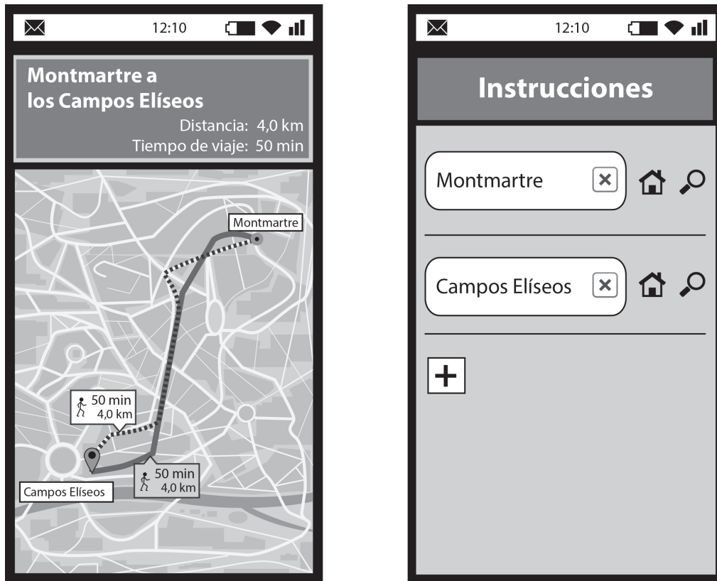
Figura 3: Ejemplo de un trayecto sugerido por SVP