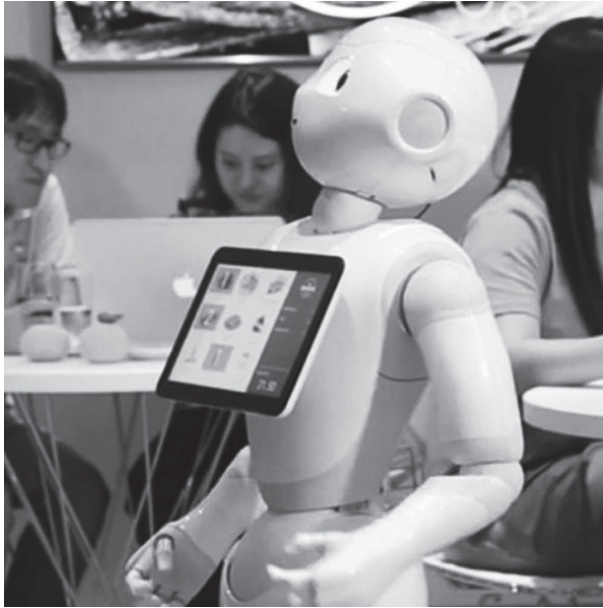
Figura 4: Dennis, el robot del restaurante